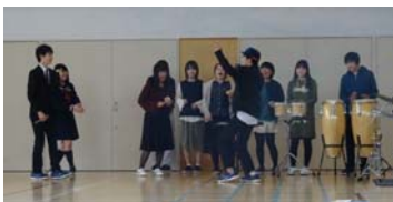
上：吹奏楽部 右：ラグビー部