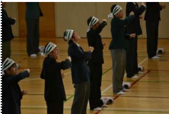
全力で声を出す一年生

体育館に鳴り響く罵声と太鼓の音。苦しくて辛くても本気で取り組み、全員で乗り切りました。歌唱指導終了後は、応援団の先輩のお言葉が心に響くようになりました。一体感、達成感、充実感、様々な感情が交差し、とても心地が良かったです。ここまで育て上げていただいた応援団の先輩には、一年生一同、尊敬と感謝で満たされています。