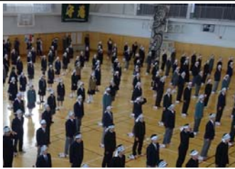
先生方も後方から見守る