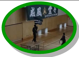
団旗を振るう応援団