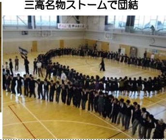
三高名物ストームで団結